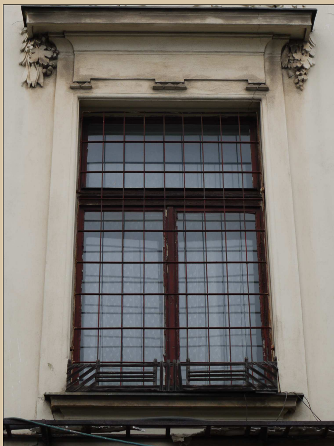
pohled na okenní mříž